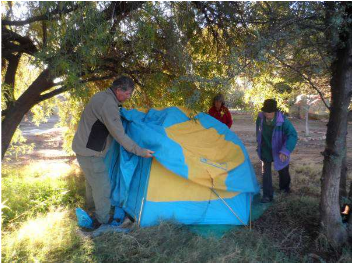
Ons kamp op die verlate plaaswerf