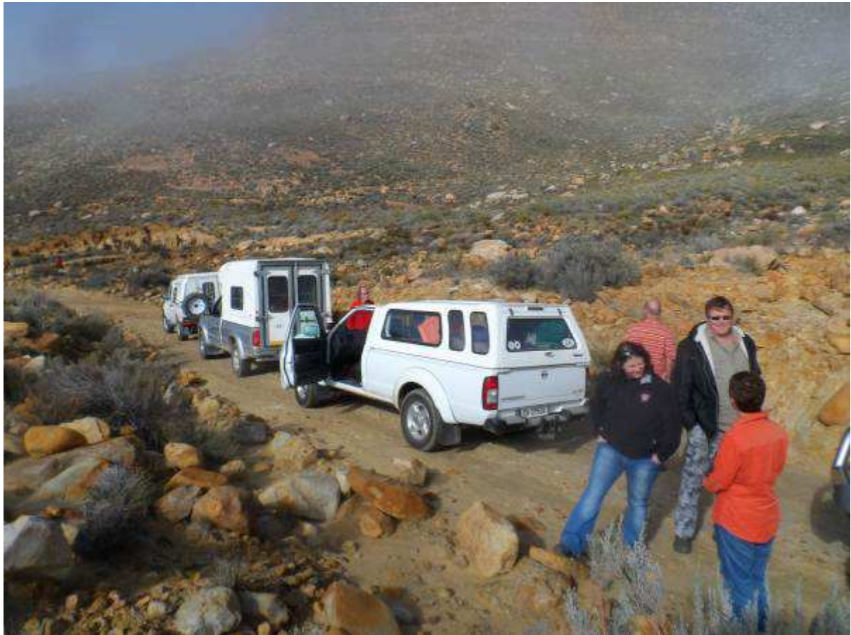
Erens op 'n agterpad tussen Theronsbergpas en die Twanka