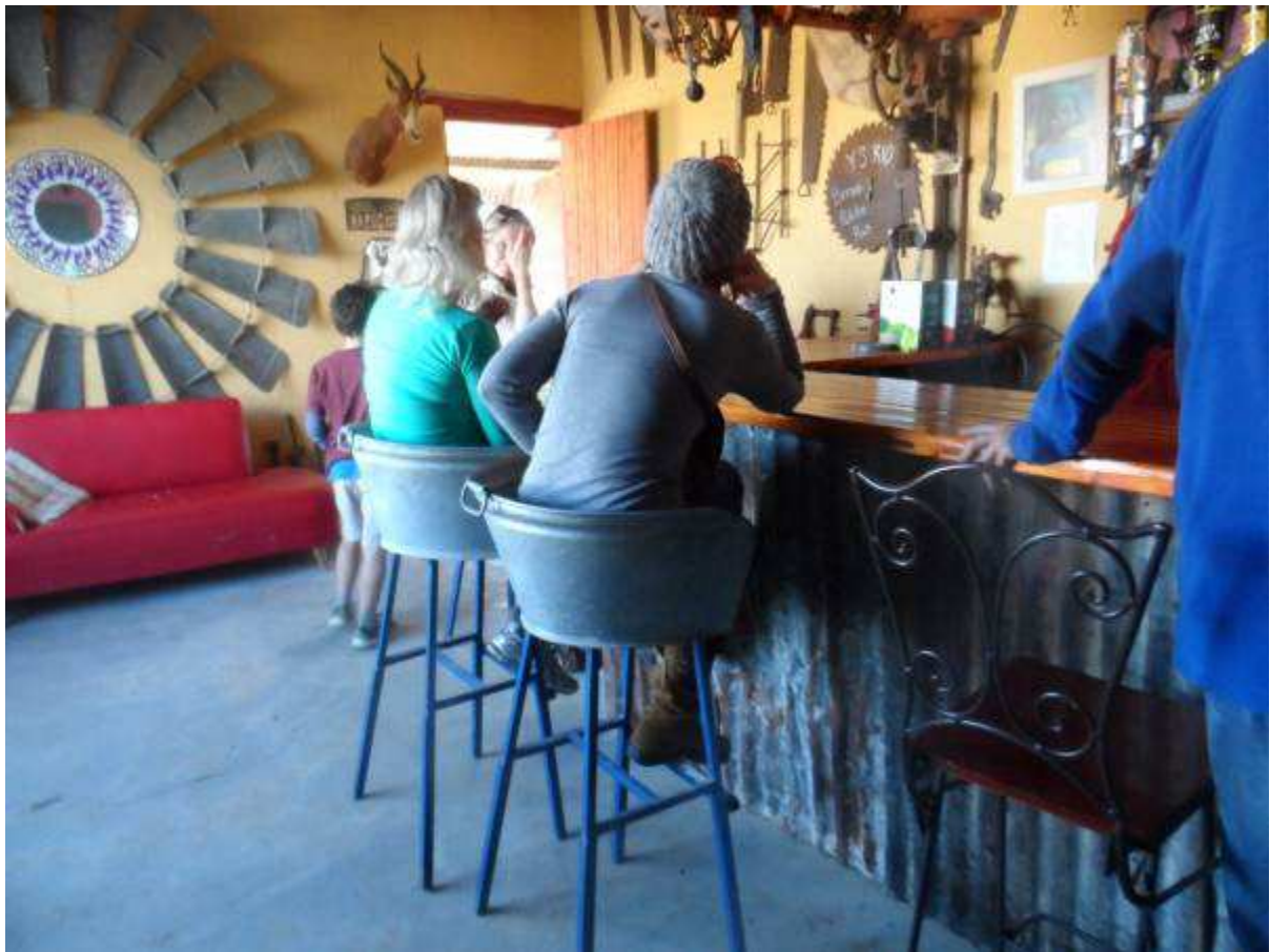
Die kroeg by die Twanka padstal