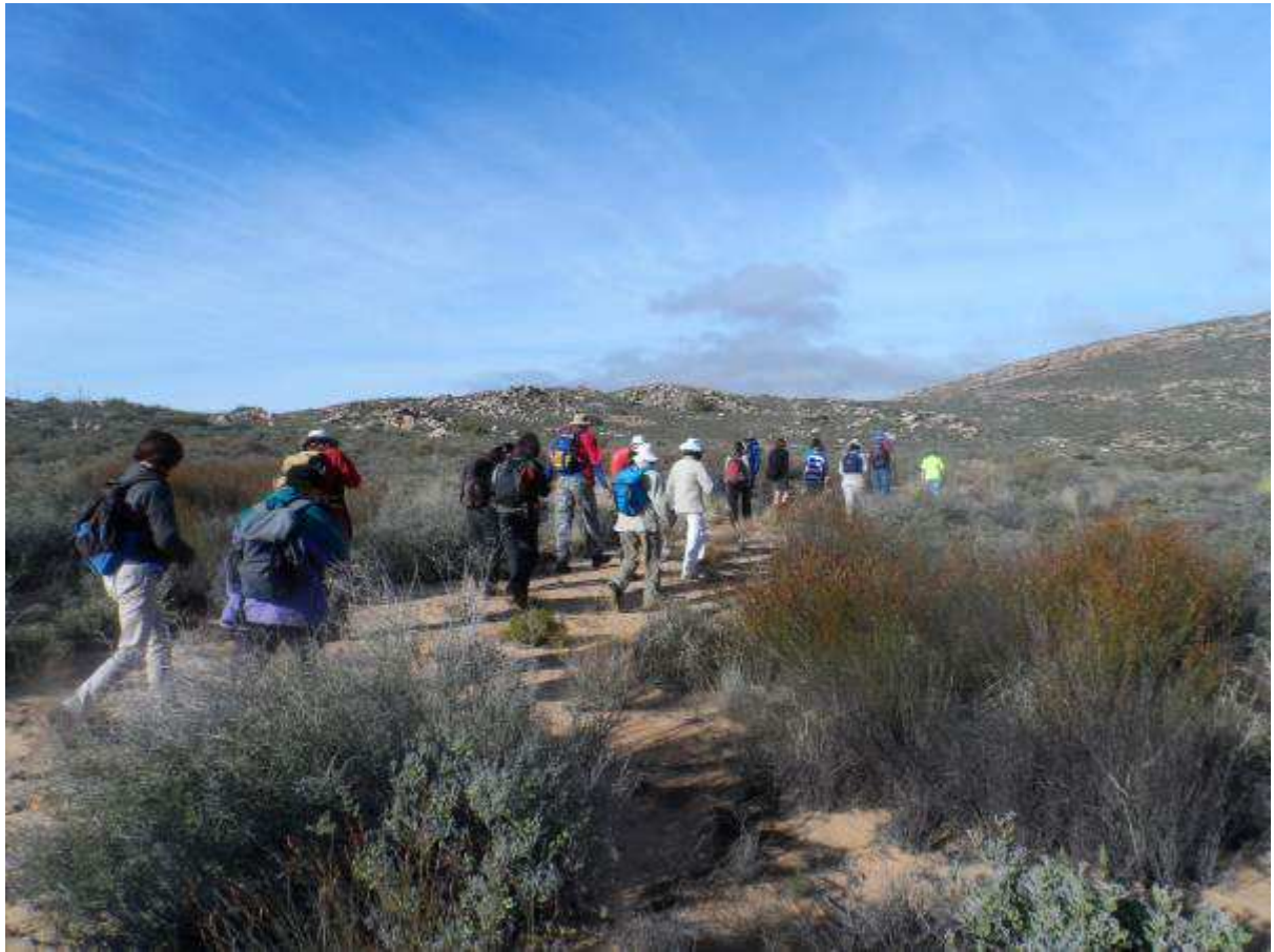
Ons gaan die onbekende kloof op Damskraal verken