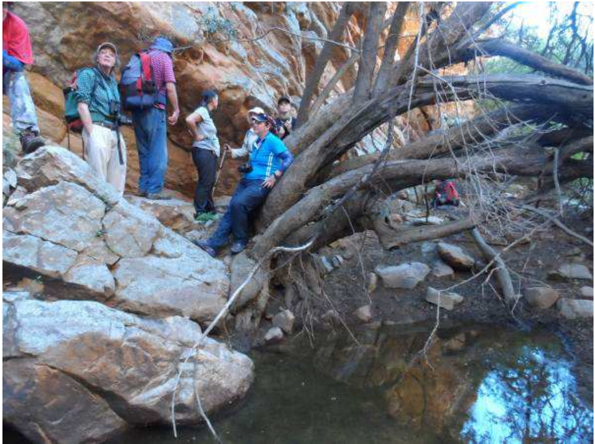
Hier het ons omgedraai