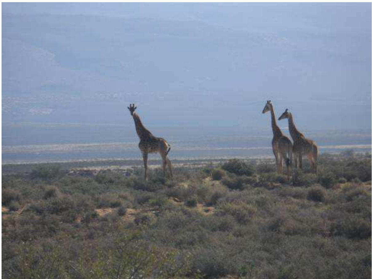
Kameelperde op Damskraal???