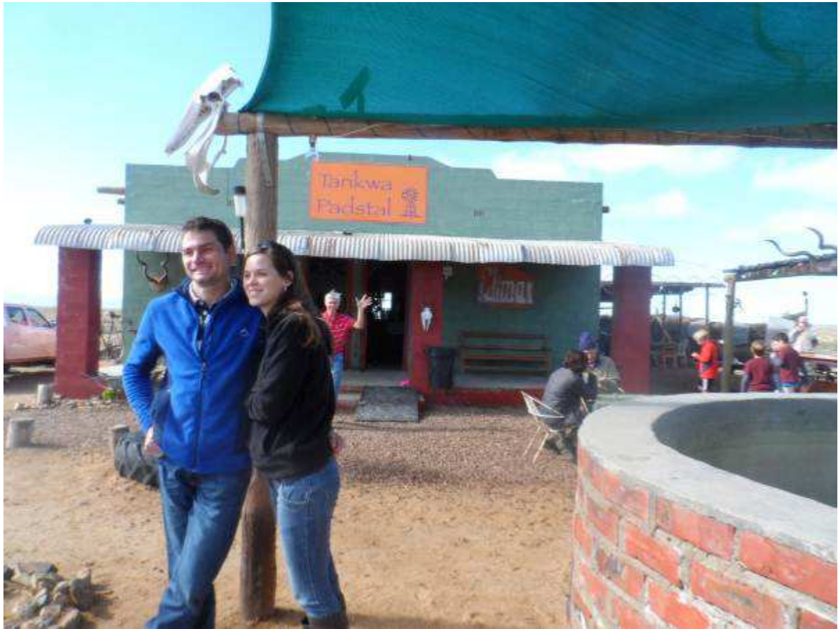
Braham en Maryke by die Twanka Padstal